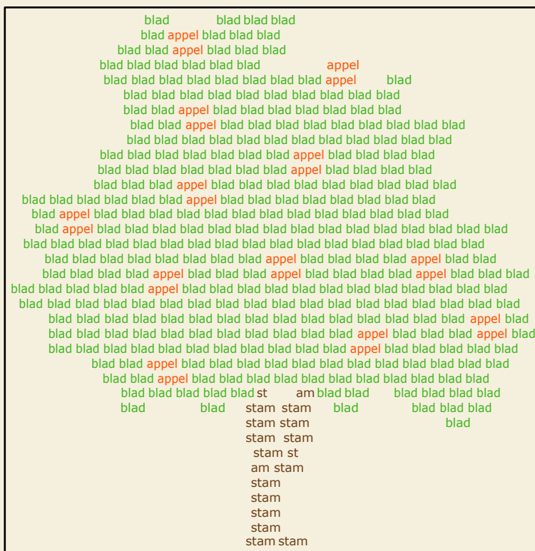
Voorbeeld door S. Giampaolo en J. Manrho

Je kan ook een ingewikkelde vorm van woorden bouwen. Kijk bijvoorbeeld naar deze boom. Hij is gemaakt van de woorden 'blad', 'appel' en 'stam'. Door te variëren in kleur en vorm krijg je een interessant werk.